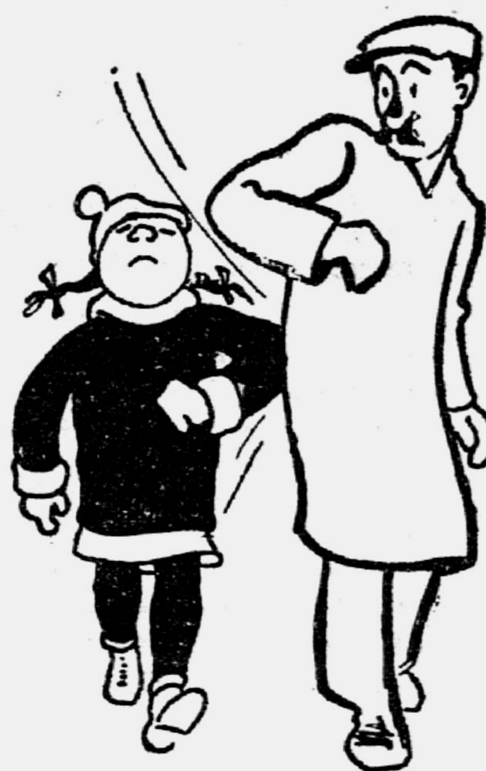
Рис. А. ЗУБОВА.

Но и в нашем классе есть много девочек, которые напоминают Галю. Прочитав рассказ о Гале, они