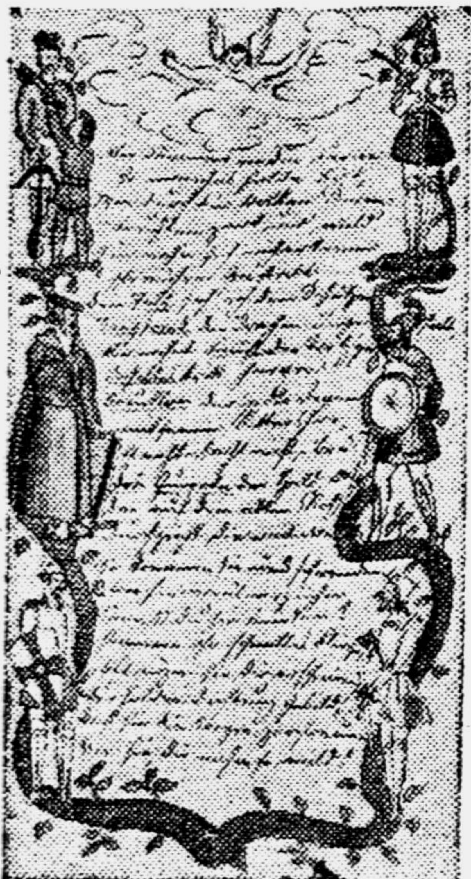
Стихотворение 15-летнего Энгельса с рисунками к тексту.