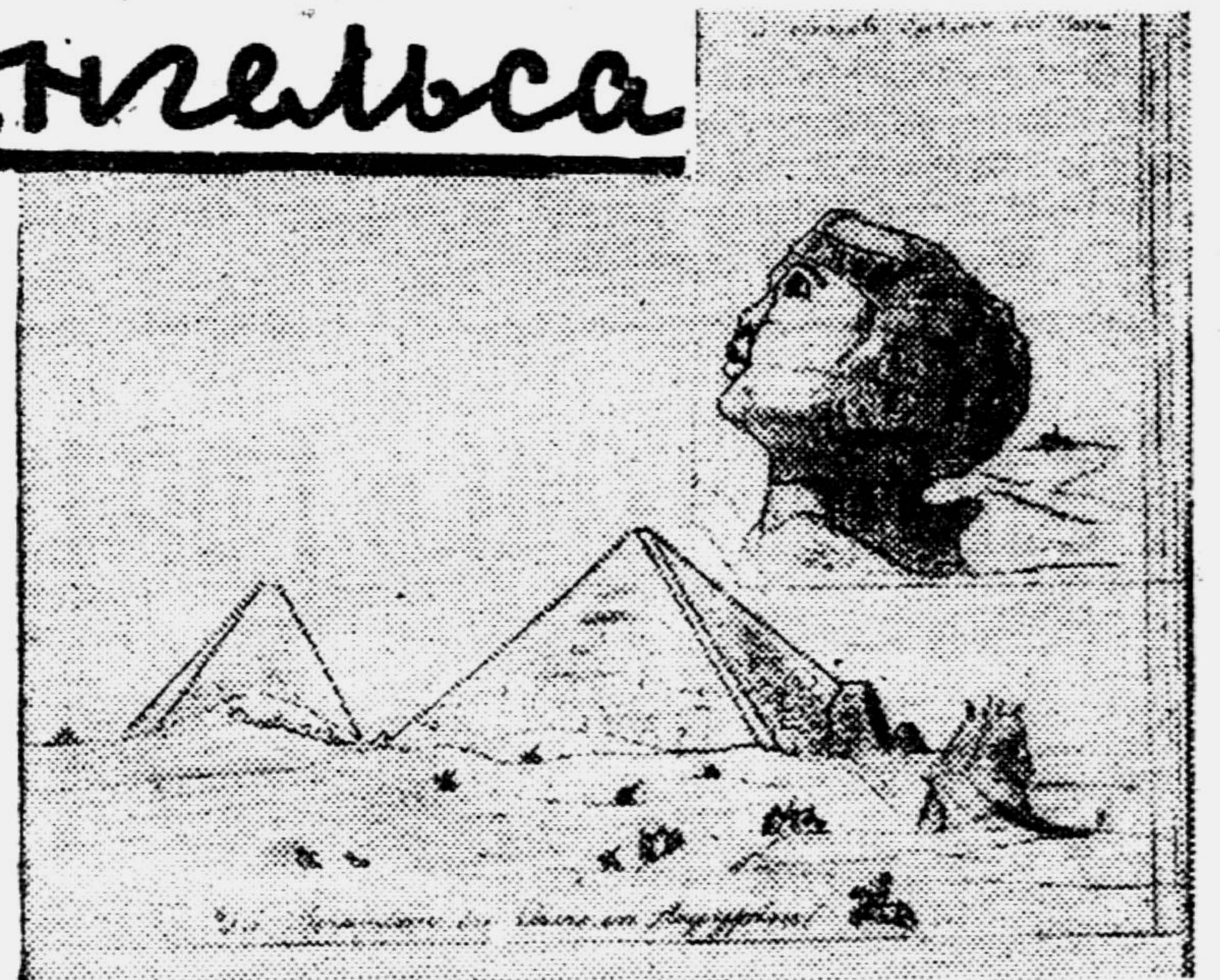
Рисунок из школьной тетради Энгельса по древней истории.